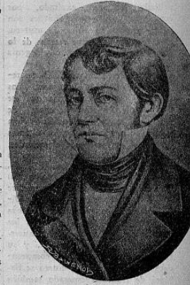
Don Juan Mora Fernández

En mi conversación amable con los amigos de Costa Rica mi más íntima ilusión es mostrar aspectos poco conocidos o ignorados de esta gran ciudad. No lo turístico, lo que tiene cabida en la guía sino lo humano, lo que despierta una inquietud o hacer aflorar una lágrima o una sonrisa. Visitando lugares, preguntando y curioseando, he llegado al Club Social de Santos Lugares, pintoresca villa de la Provincia de Buenos Aires, próxima a San Martín. Hay allí una muy concurrida Iglesia de Nuestra