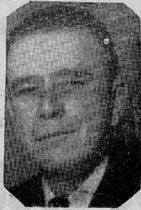
Don Otilio Ulate