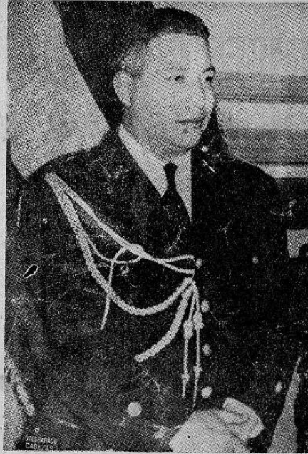
Excelentísimo Señor Presidente de la República de El Salvador, Capitán Oscar Osorio

dada en cumplimiento de reales provisiones e instrucciones, entre la cuales se encontraba ésta, la de fundar una ciudad entre las mayores poblaciones de naturales para atraerlos al conocimiento de Dios y ponerlos bajo el dominio peninsular. Este villorrio, con el pomposo nombre de Ciudad, tuvo una vida fugaz e infortunada. En patética página de don Ricardo Fernández Guardia apreciaremos mejor la esencia de la desdichada suerte de la ciudad mencionada. "Espectáculo curioso y triste a la vez debía presentar la ciudad de Nombre de Jesús, en donde todos andaban desnudos, porque las ropas se le habían podido sobre el cuerpo, des-